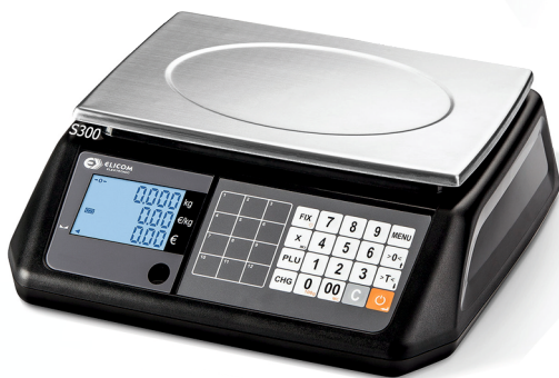
Μοντέλο S300 FM Χωρίς Πύργο

Μοντέρνος σχεδιασμός! Τεχνολογία αιχμής!