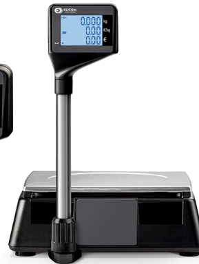
Μοντέλο S300 LM Με Πύργο