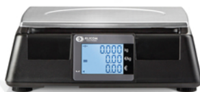
Μοντέλο S300 FM Χωρίς Πύργο

Μοντέρνος σχεδιασμός! Τεχνολογία αιχμής!