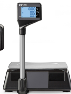
Μοντέλο S300 LM Με Πύργο